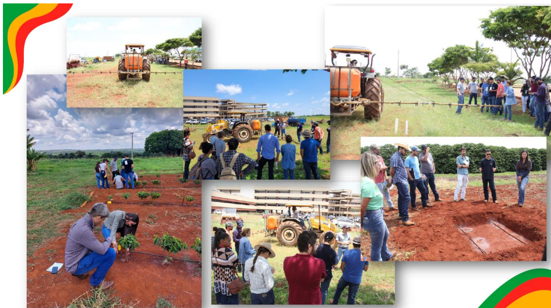
Práticas de minicursos oferecidas aos estudantes de agronomia.