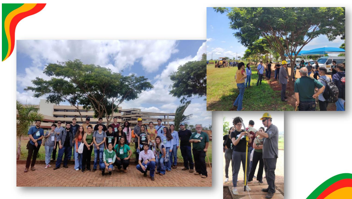
Práticas de minicursos oferecidos aos estudantes de Eng. Florestal.