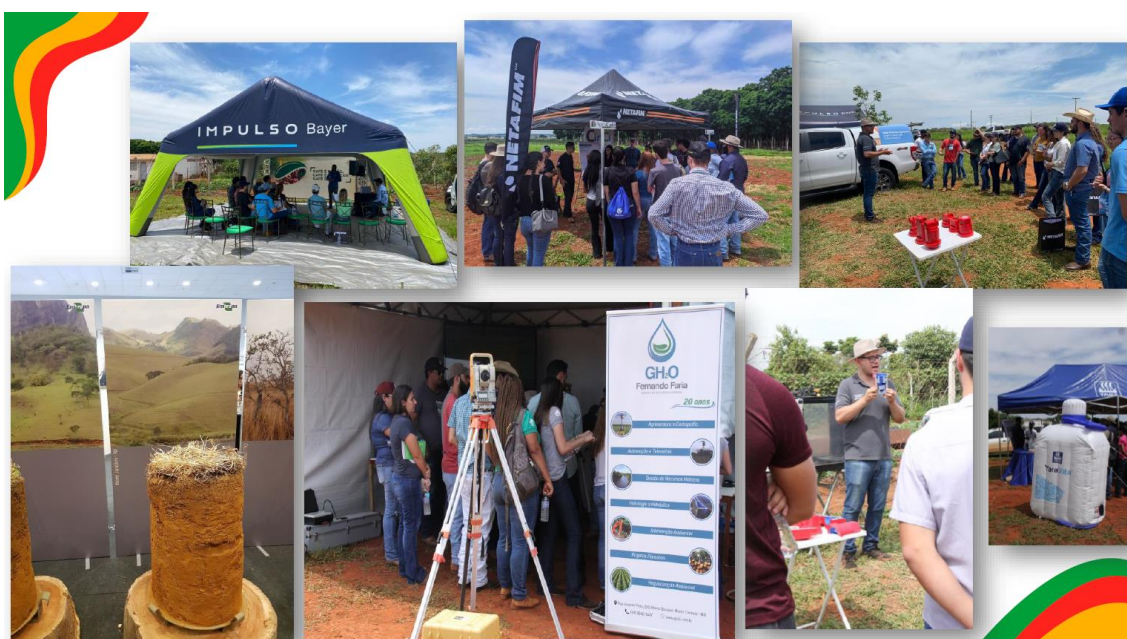
1ª Edição da feira foi realizada em 2022.

A FEAGRO é um evento multisetorial e é uma realização anual, sempre em parceria e junto à programação do SICA A, que é realizado sempre no segundo semestre (outubro/novembro) de cada ano, no referido campus da UFU. Com orgulho estamos sediados nesta cidade, e possuímos a meta de fortalecer parcerias e promover a inclusão, dentro do ambiente Universitário, de empresas que irão apresentar ferramentas de transformação, comercialização, gerenciamento, nutrição e manejos avançados para todos os setores ligados à cadeia produtiva. A feira será mais uma oportunidade de apresentar ao produtor rural e estudantes novas agrotecnologias e tendências adequadas a realidade da região.